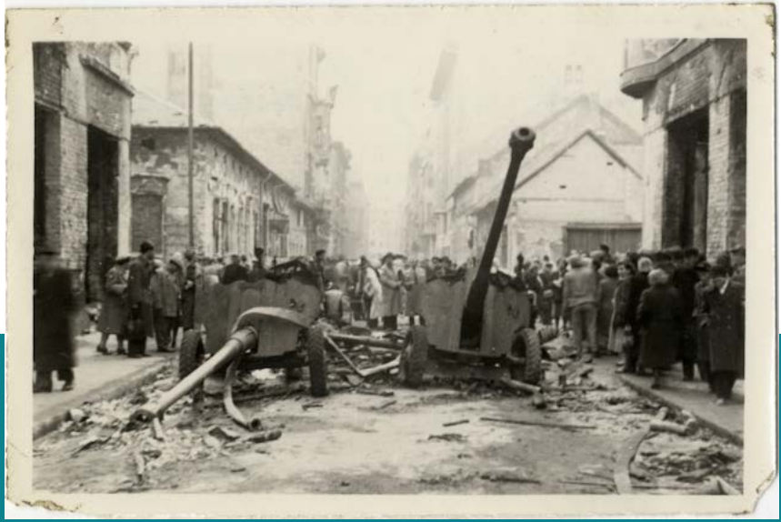
Kilőtt páncéltörő ágyúk a Práter utcában, 1956. október 28.

Továbbra is válaszra vár az a kérdés, hogy mennyire (lehet) teljes a politikai és a minden valódi nyilvánosságot nélkülöző diktatúrában a hatalom emlékezetpolitikai befolyása: feltételezhető-e vajon, hogy tényleg azt gondolkodják és érzik az emberek, az állampolgárok, amit fentről sugalmaznak nekik? Valóban elfelejtik tehát az átélt, a nemegyszer tragikus múltat, mint ahogy elvárják, sőt megkövetelik tőlük? Vagy csupán rejtőzködnék és színlelik az együttműködést, vagy talán magukat is győzködik több-kevesebb sikerrel, hogy – merőben pragmatikus megfontolásból – úgy kell érezniük és gondolkodniuk, ahogy fentről elvárják tőlük? Ezekre a kérdésekre lehetetlen kategorikus választ adni, ennek folytán saját mindennapi élettapasztalatainkra kell tehát hagyatkoznunk, már akinek vannak ilyenek a tarsolyában.