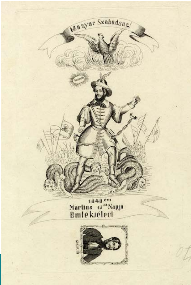
Ismeretlen művész: Az 1848-as forradalom emléklapja, 1848. (Rézmetszet.) Magyar Nemzeti Múzeum

Nem sokat kellett azonban várni arra, hogy megismétlődjék a felejtésre is alapozott politikai legitimitáció esete, amely a dualista állami és politikai berendezkedés, valamint Magyarország addig volt nemzetállami fizikai kiterjedésének a végét is jelentette egyúttal.