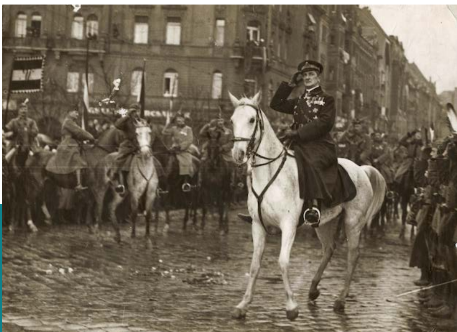
Horthy Miklós bevonulása Budapestre, 1919. november 16.

Ehhez hasonlóan mély nyomokat hagyott a köztudatban az a toposz is, mely szerint katonai erő bevetésével meg lehetett volna akadályozni az ország időleges katonai megszállását, ami végül elvezetett Trianonhoz. Minden másként alakulhatott volna, tartja ez a nem kevésbé mitikus képzet, ha Linder Béla hadügyminiszter nem jelenti ki 1919. november 2-án egy nyilvános tömeggyűlésen: „Nem kell hadsereg többé! Soha többé katonát nem akarok látni! Fegyvert többé szolgálaton kívül nem viselünk, sem tisztek, sem legénység.” 5 Ezzel önként megadtuk magunkat a későbbi kisantant hazánkra rontó hadseregeinek, melyek ellenében megtartható lett volna az ország területi épsége, ha a saját haderőnket megtartva szembeszállunk vele. Eszerint is az őszirózsás forradalom felel azért, hogy Trianon lett a veszünk.