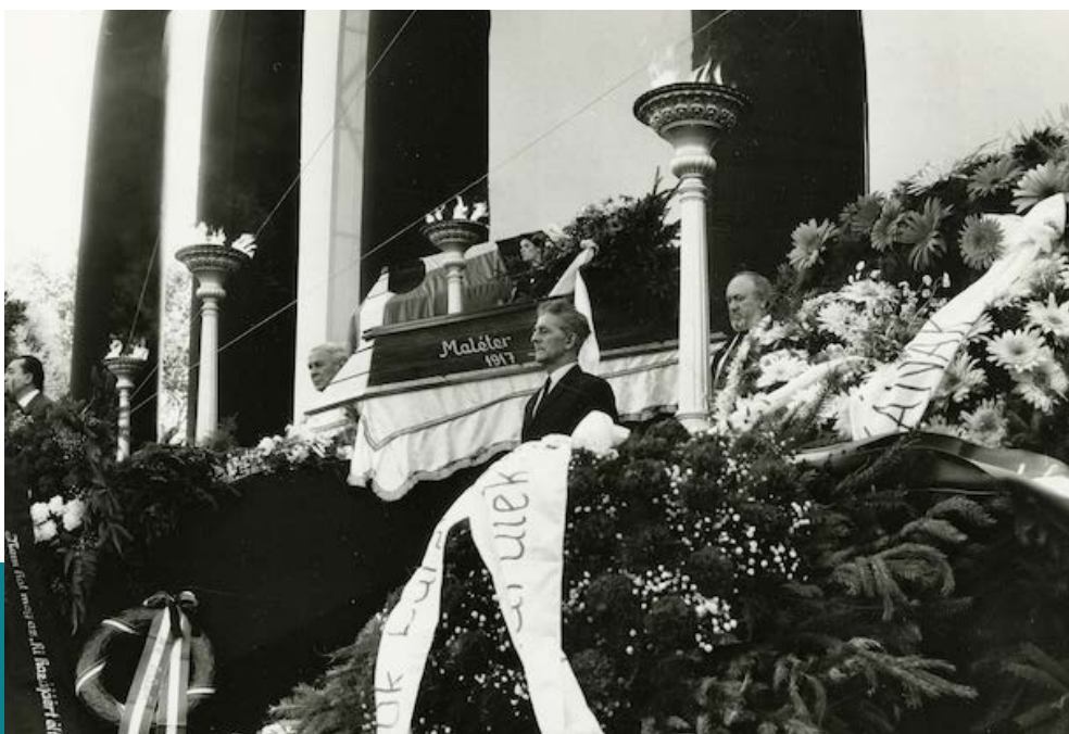
Nagy Imre és társai újratemetése, 1989. június 16. Magyar Nemzeti Múzeum

A dolog mégsem teljesen reménytelen. Létezik egy olyan elem, amely legalábbis kétségeket támaszt az iránt, hogy akár még az adott esetben is maradéktalanul hatékony lehet a múlt emlékének a teljes és visszavonhatatlan törlése. Ha ilyen nagy súllyal esik a latba a jelen eszmei igazolhatósága szempontjából az elfelejtetni kívánt múlt, amint azt '56 Kádár-kori sorsa is példázza, akkor ez a felejtetési politika nagyon is törékeny. Hiszen minden rendszerkritikus megszólalás és aktus egyúttal a felejtésre ítélt múlt felhánytorgatásával párosul, hogy az eddig hidegen tartott múltból nyomban forró múlt válják – olyasvalami tehát, amelynek nagyon eleven lehet a jelenbeli aktualitása. Ez kellő magyarázattal szolgál arra nézve, hogy miért éppen az ötvenhatos mártírok ünnepélyes újratemetése, valamint a kádári megtorlás összes áldozatára való nyilvános emlékezési szertartás képezhette a rendszerváltás leváltásának a szimbolikus és egyben rituális aktusát. A kádári felejtetési politika jövője (pontosabban annak a vége) fejezi ki visszamenőleges érvennyel, hogy mennyire nem számított lezárt, végképp elintézett (elfelejtett) ügynek a három és fél évtizeden át elhallgatott, elnémított és megrágalmazott