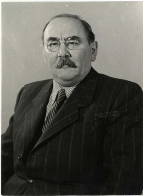
Nagy Imre, 1953. Magyar Nemzeti Múzeum

A kádári hatalom egyszerre alkalmazta a múltra emlékeztető és a múltat elfelejtető stratégiát '56 kapcsán. Közismert, hogy milyen nagy hangsúlyt helyezett ez a propaganda annak szüntelen sulykolására, hogy az '56-os ún. ellenforradalom a véres erőszakban fogant és az volt a fő attribútuma. Ezt a célt szolgálta a Köztársaság téri lincselés történéseinek kiemelése az októberi események láncolatából, hogy – szinekdoché módján – ezt az eseményt tegye meg '56 lényegének. 19 Ez a velejéig hamis beállítás, melynek eredményeként partikuláris eseményeket az általánosság fokára emelnek, hogy úgymond mindent kimondjunk vele a dolgról, kettős célt szolgált: egyfelől valami látszólag ténybelit állított a megrágalmazotról ('56 a maga különösen véres-erőszakos fellépésével tüntette ki magát), másfelől el is terelte a figyelmet saját, szintén ténszerű akkori erőszakos tetteiről. Napnál világosabb, hogy az utóbbi a felejtés, a felejtetés érdekében történt, és így a Köztársaság téri véres eseményekre való szüntelen rámutatással azt a fedőemléket hozta létre, amely törölhette az október 25-i Kossuth téri vérengzés emlékét a történelmi memóriából. A Kossuth téri tömeggyűlést érő mérsárlás, mint tudjuk, a védekezésre, egyben a rejtőzködésre kényszerülő rákosista hatalmi csoportok (valójában az ávósok) akciója volt, és összemérhetet-