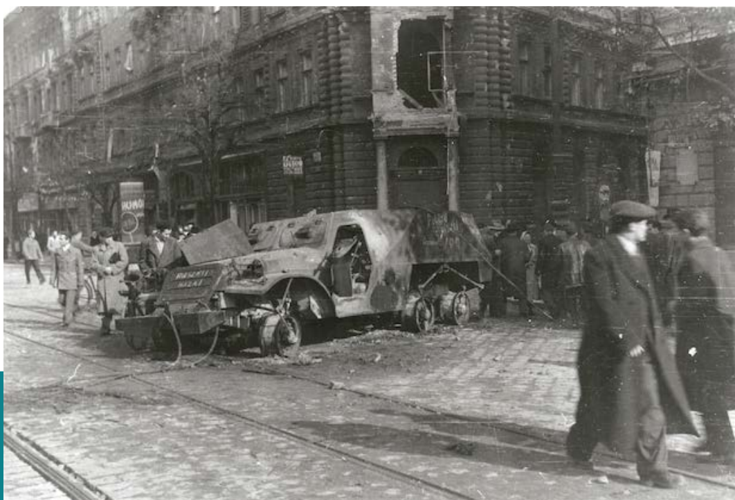
Kilőtt szovjet páncélaútó a József körúton, ruszlik haza felirattal, 1956. október 26.

lenül több emberáldozattal járt (ráadásul a civil népesség köréből), mint amennyi halálos áldozatot a Köztársaság téri összecsapások követeltek. Erről a mézárjáról azonban sem ekkor, sem később nem esett, nem eshetett szó, így az elkövetők felelősségre vonása sem került szóba sem akkor, sem 1989/1990 után. Mondhatni: végzetes és örök amnézia homályába burkolták az ötvenhatos forradalom minden bizonnyal legbrutálisabb öldöklését, amelyet történetesen azok követtek el, akik – 1956 november 4-e után – újra kezükbe kaparintották a megszálló szovjet hadsereg jóvoltából a kizárólagos (és terrorral fenntartott) hatalmat. 20